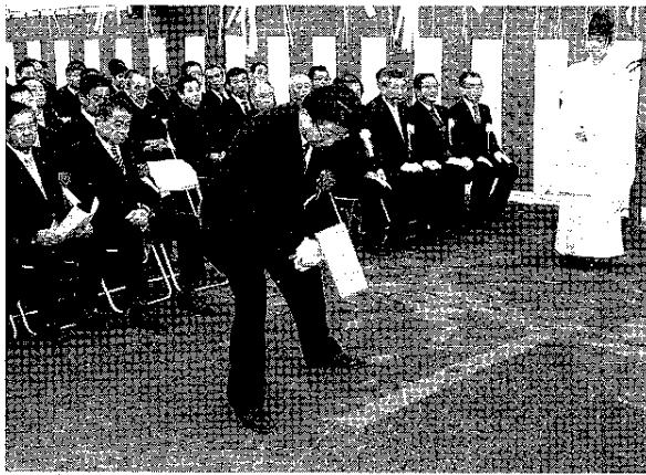
安全祈願祭で川勝知事がくわ入れの儀式

富士宮市宮町で24日、県による富士山世界遺産センター(仮称)建設工事の安全祈願祭が開かれた。関係者約80人が出席し、工事の無事を願う着工を祝った。完成は建物のほか外構や展示などを含めて平成29年10月末の予定。