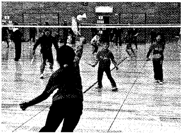
子供をメンバーに含むファミリーの部

第48回富士市ファミバドミニオン協会大会が10日、木島の富士川体育館で開かれた。59チームの総勢288人が出場し、交流の汗を流した。 協会登録団体のほか、静岡市や御殿場市、埼玉県北本市からの参加を得た。オープン部の女性や子供を含むファミバドミニオン部に分かれ、コートごとの対戦で順位を決めた。 主な結果は次の通り。 【ファミバドミニオン部】 ▽1コート①どんべえず武②ミックスジュニア③広見A④ミックスジュニア⑤⑥同③④同4⑤⑥N/A 【オープン部】 ▽3コート①JUSTAWAY②風竜組