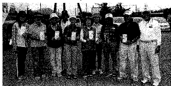
好成績を収めた富士宮市の皆さん

ゴルフ協会によると、同市からは約150人が参加し、13人が県チャンピオン大会出場を決めた。成績は次の通り。