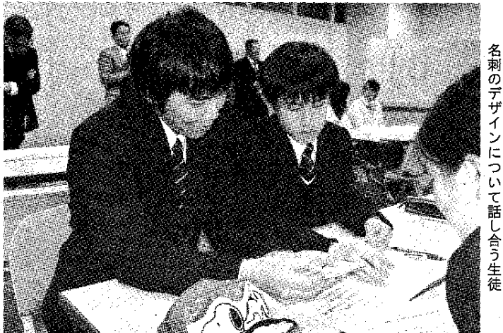
各刺のデザインについて話し合う生徒

ふじのみや本舗、一般社団法人富士宮市地域力再生総合研究機構、富士宮信用金庫、富士宮青年会議所、同市観光協会などの協力団体で設立する。