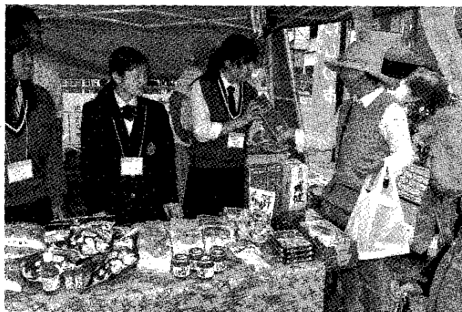
沖縄の物産を販売する高校生たち