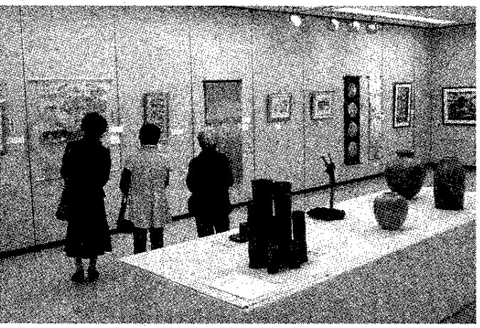
工芸部門の作品が並ぶ会場