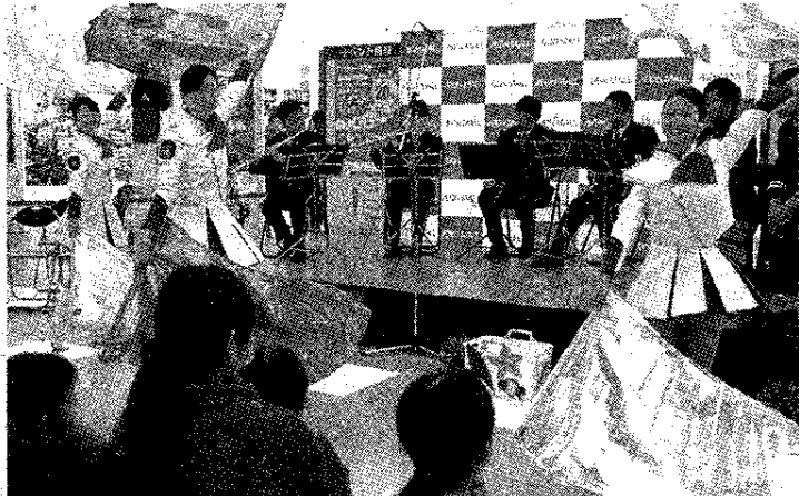
演奏と演技を披露する県警音楽隊・カラーガード隊