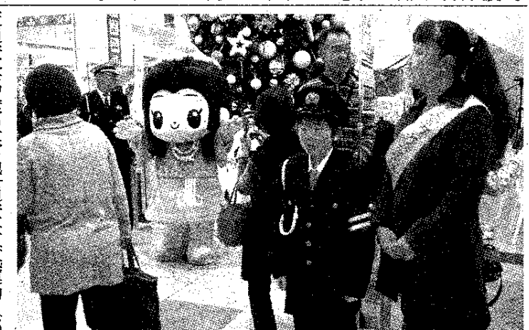
富士宮市交通安全母の会連合会も広報活動

交通安全協会富士宮地区支部交通安全指導31日)に合わせ行われた。同音楽隊のメンバーたちは「ふるさと」の流れるように「アンター・ザ・シー」や「クリスマス・メドレー」などさまざまな曲で美しい音色を響かせ、カラーガード隊の隊員たちは息の合った華やかな演技で魅了。多くの市民が客席で鑑賞を楽しみ、盛んな拍手を送った。