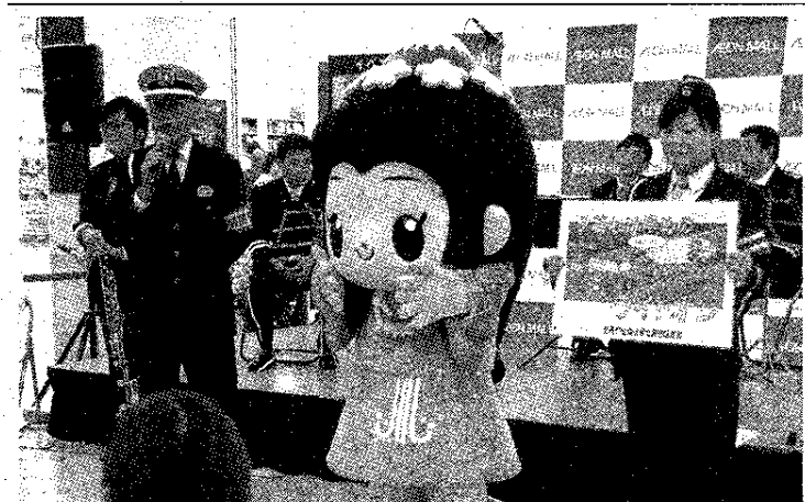
来場者に交通安全への協力を呼びかける

演奏・演技の合間には同署員と交通安全指導員が同県民運動について説明し、夕暮れ時や夜間の事故防止に向けた反射材の利用、早めのライト点灯などを促した。同連合会の会員らは買い物客らに反射材グッズなどを配布し、交通安全の大切さをアピールした。