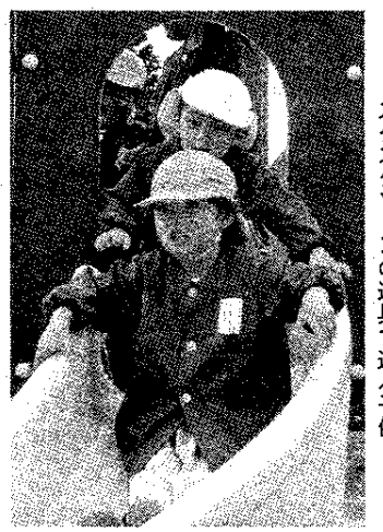
スクスクゾーンの遊具で遊ぶ子供

1年間で整備が進められ、このほど完成。「昆虫たちとお花の王国」と名付けられ、ワンパク・スクスク・ユニバースの3つのゾーンで構成されている。ワンパクゾーンは6