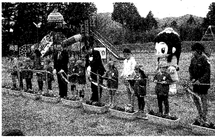
テープカットで遊具の完成を祝う