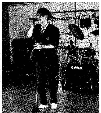
熱唱する富士宮高等専修学校の生徒