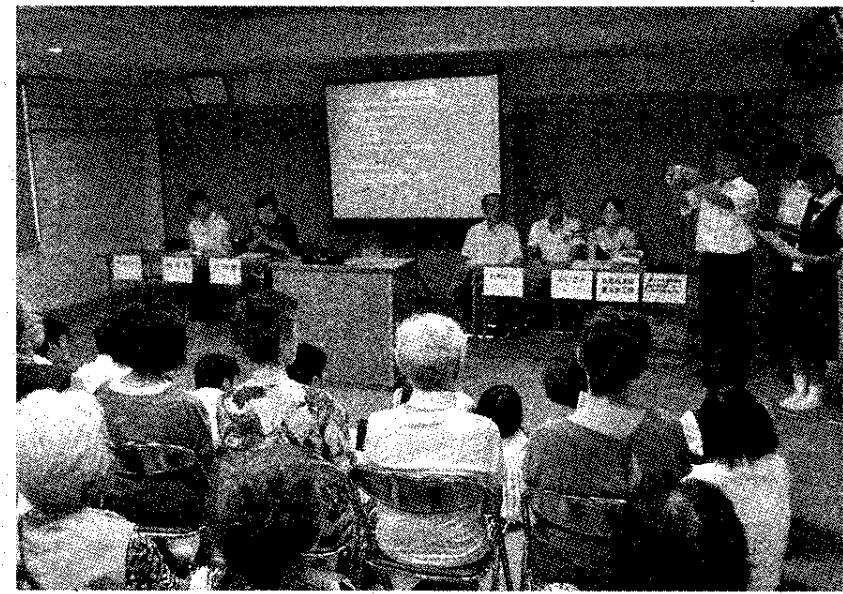
防災菓子について説明する富士宮高校会議所メンバーら