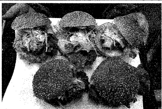
ニジマスを食材とした「鱒マヨバーガー」

あるニジマスを生かした「鱒マヨバーガー」作りに、富岳館高校の生徒が授業の一環として励んだ。ニジマスの消費拡大を目的に若者世代に好まれる味わいに仕上がっており、普及の推進役を担う富士宮高校会議所とともに同校生徒たちもPRに努めていくという。