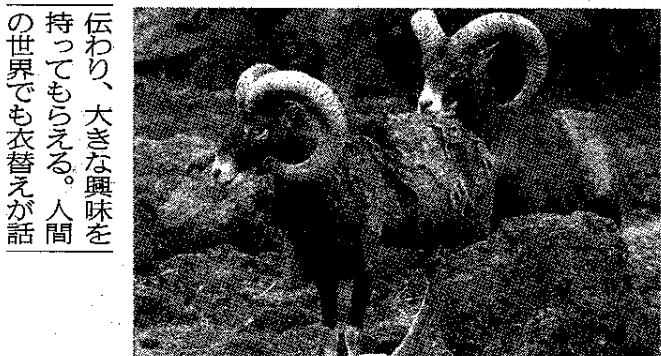
衣替えを迎える(上から)フタコブラクダ、アメリカバイソン、ムフロン

節による温度差の大きがでる。 同園では、「ぼろ布な地域に生息する動物をまとったようなお世辞にも奇麗とは言えない様相は、自家用車で見学する来園者にはな かなか理解してもらえないが、ジャングルバスタッフが換毛に生理現象であることが 伝わり、大きな興味を持ってもらえる。人間の世界でも衣替えが話