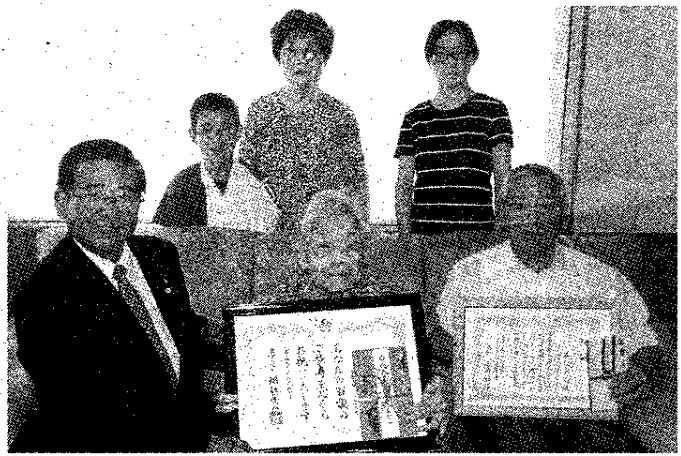
満100歳の寿詞を受けた石川さん(手前中央)