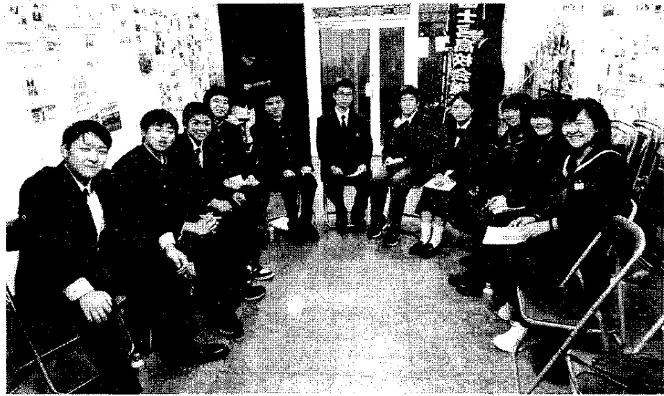
「ふくしま復興大使」と高校生会議所が交流で記念写真

「ふくしま復興大使」を迎えて高校生らが交流の集いで、地域振興に思いを共有。 富士宮市内の各高等学校の生徒代表らが、高校生会議所の視察で地方創生や地域ビジネスの手法などに実践を通して学び連携して地域活性化の事業を考案する活動を進めている。 「ふくしま復興大使」は、被災地復興再生のヒントを得て古里再生への活力を育んでいる。