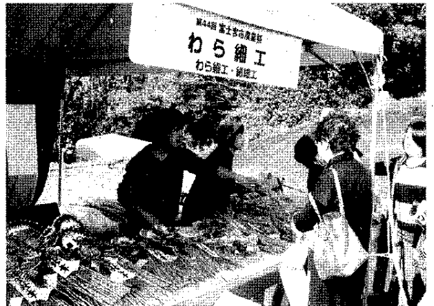
わら細工コーナーには正月のお飾りも並び