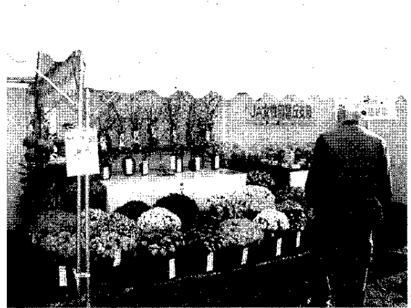
JA 女性部山宮北山支部の菊づくり講座丹精の菊

「ふくしま復興大使」の視察で地方創生や地域ビジネスの手法などに連携して実践の学びを進め、互いの活動報告や意見交換を進め、被災地復興再生と地域振興に思いを共有した。 「ふくしま復興大使」は、被災地復興再生のヒントを得て古里再生への活力を育んでいる。