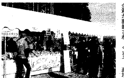
JA 青壮年部富士根支部など農業青年たちのブース

「ふくしま復興大使」の視察で地方創生や地域ビジネスの手法などに連携して実践の学びを進め、互いの活動報告や意見交換を進め、被災地復興再生と地域振興に思いを共有した。 「ふくしま復興大使」は、被災地復興再生のヒントを得て古里再生への活力を育んでいる。