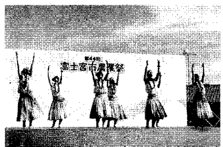
特設ステージで催し多彩に