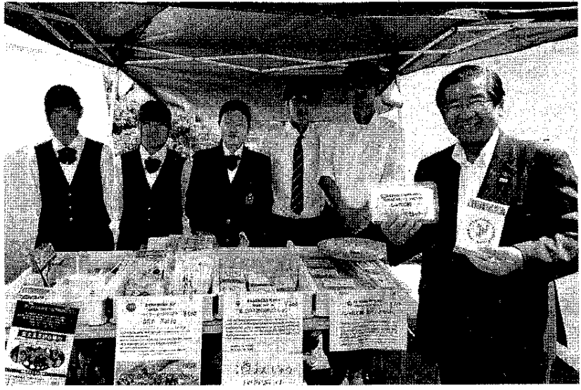
商工フェアでは須藤市長に励ましを受け販売を

富士宮市内の5高校の「富士宮高校会議所」は、地域生徒が地域振興・商店街の活性化にもつながる地域の特産品開発に力を入れ、販売や自ら活動資金を事業に取り組んでいる。「富士宮高校会議所」の活動が評価を高め話題を集めている。 先月末に開催された「富士宮高校会議所」では事務局のある西町商店街のイベント「にし」の市などにも積極的に参加し、18日に開催の「富士山世界遺産登録4周年記念祭」にも郷土料理「のしこみ」を出展することになっている。 若者の視点と行動力で多彩な地域活性化事業に取り組んでいる「富士宮高校会議所」の活動は各方面から高い評価を受け、期待と話題を集めている。