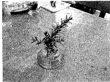
ピオラを入れた三角錐の小さな花入れが彩りを添えて

江戸屋城北店カフェレストランのテーブルに飾り添えているのが、ローズマリーや紫色のピオラの花を折って入れた三角錐の小さな花入れです。 江戸屋の谷会長の奥さんが店内を飾る花の装飾「おもてなし」の一環で、小さな花入れを各テーブルにおいて「野の花」でお客様を「おもてなし」しようと始めた花の装飾で、レジ横には数日、花瓶に初夏の花「蜜袋」を入れて目にする人を楽しませました。 「蜜袋」は、キキョウ科の多年草、昔、捕えた虫を入れたのこの花を袋がわりにしたというところからついた名前です。先に開いた花には白に近い淡紅色から赤紫色まであり、山田みづえの句には「ほたるがくろ重たき光りひとつづつ」とあり、山に咲くタカネスミレから美しい野生種のエイゼンズミレ、皇帝ナポレオンが愛したオイスミレに由来したオイスミレと数多くの品種があり、本には約450種、日本には約50種が自生しています。 園芸品種にはピオラ・ロンロリア、ラベスター・フェアリーなどがありません。 ヨーロッパでは、スミレは「蘇る大地のシンボル」でした。香り花として、香料の原料としても栽培されてきたのがスミレです。 ローズマリーの小枝を折って入れた花入れがテーブルに安らぎを広げるのもひとつ