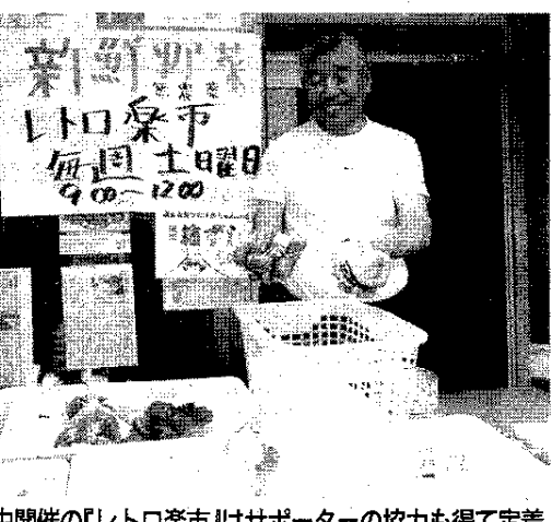
毎週土曜午前中開催の「レトロ楽市」はサポーターの協力も得て定着

サポーターの市民が販売部は高校会議所の収益に役立てられる。先に開催「レトロ楽市」は毎週土曜日の午前中(午前9時から正午まで) 続けられ、ポスターや協力店舗などから正午まで) 続けられ、と開発した地域特産品を販売するコーナーを設けて人気を集め、西町商店街の売り上げ収益の一