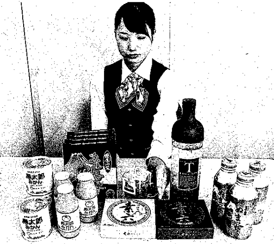
「なんすんマルシ」の商品を紹介するJANAなんすん職員。沼津市の同JANAナックセンター

JANAなんすんは1集めた夏季のギフトパック、県東部の6JANAの「なんすんマルシ」農産物や加工食品を「エ」の取り扱いを開始