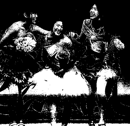
手作り衣装を着てステージを歩く生徒＝沼津市民文化センター

沼津市の沼津中央高は2日、文化祭ステージの部を市民文化センターで開いた。生活文化コースと手芸部の2、3年生計124人が文化祭のテーマ「百花繚乱(りょうらん)」をイメージした手作り衣装でステージを歩いた。