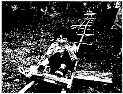
豊かな自然の中で遊ぶ参加者

御殿場市印野地区の約120人がさまざまな活動を通して、地域の自然を満喫した。参加者はターザンロープやブランコ、マウンテンズライダーなど