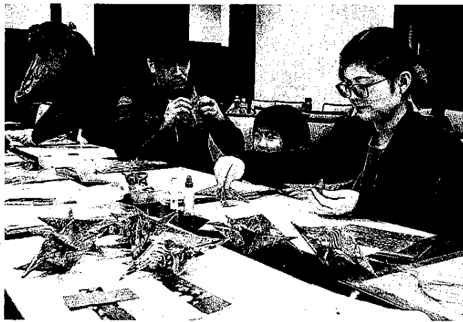
クリスマス飾り作りに挑戦する参加者=富士市内

富士市の一般社団法人フジパークは12日、岳鉄のワークシヨップを同市内で開いた。親子が飾り作り