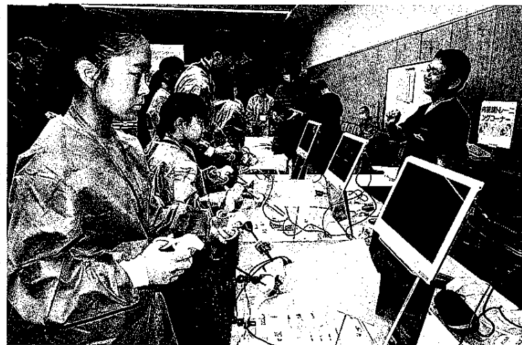
真剣な表情で鉗子の操作に取り組む生徒ら。長岡町の県立静岡がんセンター

長岡町の県立静岡がんセンターは12日、製薬・医療機器会社のシヨノン・エンド・シヨノンと共同で、中学生を対象にした手術体験講座「ブラスティック・ジャックセミナー」を同センターで開いた。県東部の35人が実際の医療現場で使用される機器を体験し、医師の仕事に理解を深めた。