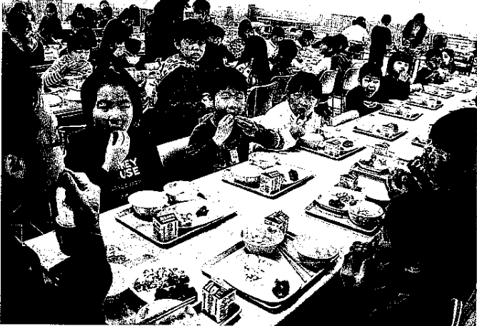
三島函南トマトを食べる児童ら＝三島市立錦田小

沼津署は6日、息子(約13歳)の通学費に当選の200通を選んだ。 伊豆地域の観光促進などを目的に実施。参加者は昨年12月から今年2月までの期間中に伊豆半島の道の駅8カ所のうち、訪れた駅の数に応じて各市町提供の特産品などの景品に応募した。 森町長は「伊豆半島全体を知ってもらいたい」と話した。 「富士山の麓でできること」人が集まるのに理由がある」をテーマに話し合う。入場無料。定員は30人程度。問い合わせは同会議所の時定則事務局(電話090(5008)54339)へ。