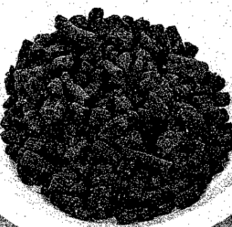
商品を紹介する義成代表取締役(上) 粒状のペレット堆肥(下)

商品ほとんど流通していない上に高額」という現状。持ち前の技術で課題をクリアした上に、処理方法の低コスト化で従来品よりも低価格とした。原料は