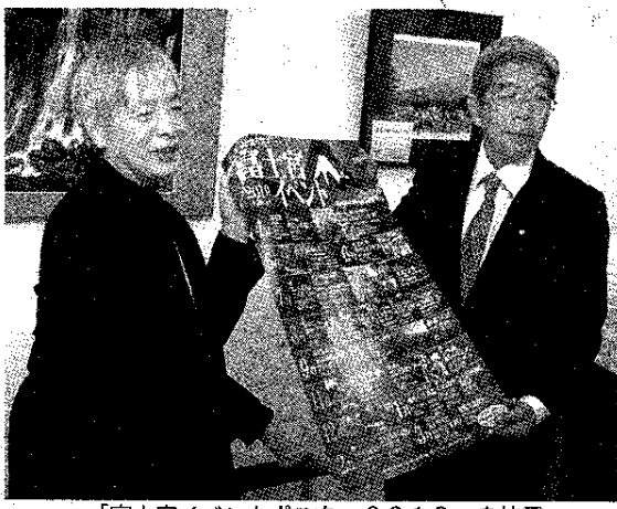
「富士宮イベントポスター2019」を披露