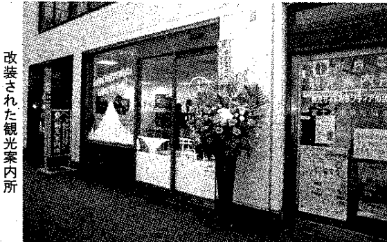
改装された観光案内所