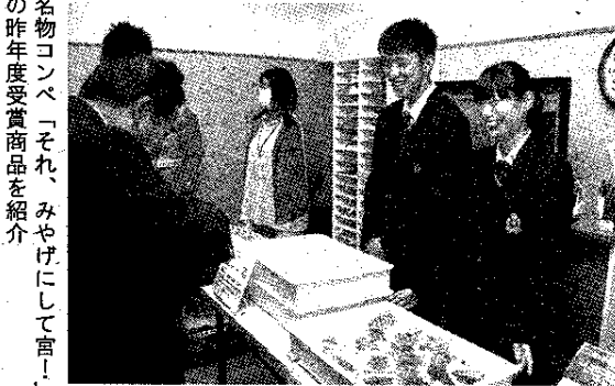
名物コンペ「それ、みやげにして宮」の昨年度受賞商品を紹介

同協会の観光案内所では、開かれた。改装を経て広さを増した同案内所のお披露目、「富士宮イベントポスター2019」の披露・配布、名物コンペ「それ、みやげにして宮」の受賞商品紹介などが行われ、協会と連盟の各役員、市内商店街・観光・行政・市議会関係者らが各種事業の成功や一層の観光振興に向けて期待や決意を分かち合った。