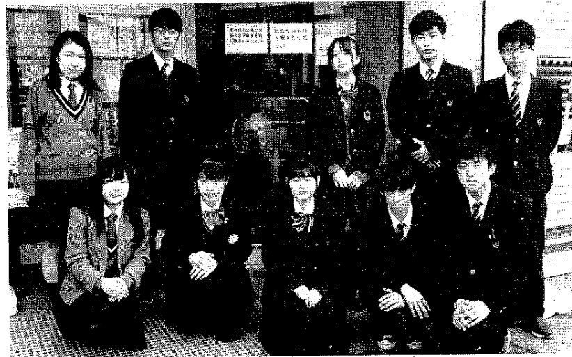
ニジマス水槽の前で

所発案の、ニジマスを活用した商品を購入できたり、注文できるよきにする。(3)休憩だけでなく、折り紙教室、演奏会、ギャラリイ等へ活用する。(4)ニジマスの水槽設置に伴い、トラウトみやサーモンエイト(8匹のニジマス)の愛称を募集する。締め切りは3月31日、当選者にはニジマスを活用したふりかけ、お茶漬をプレゼントする。(5)スタディールームもボランティアのサポートで運営していくため、①運営ボランティアスタッフを募集する。②高校会議所カ