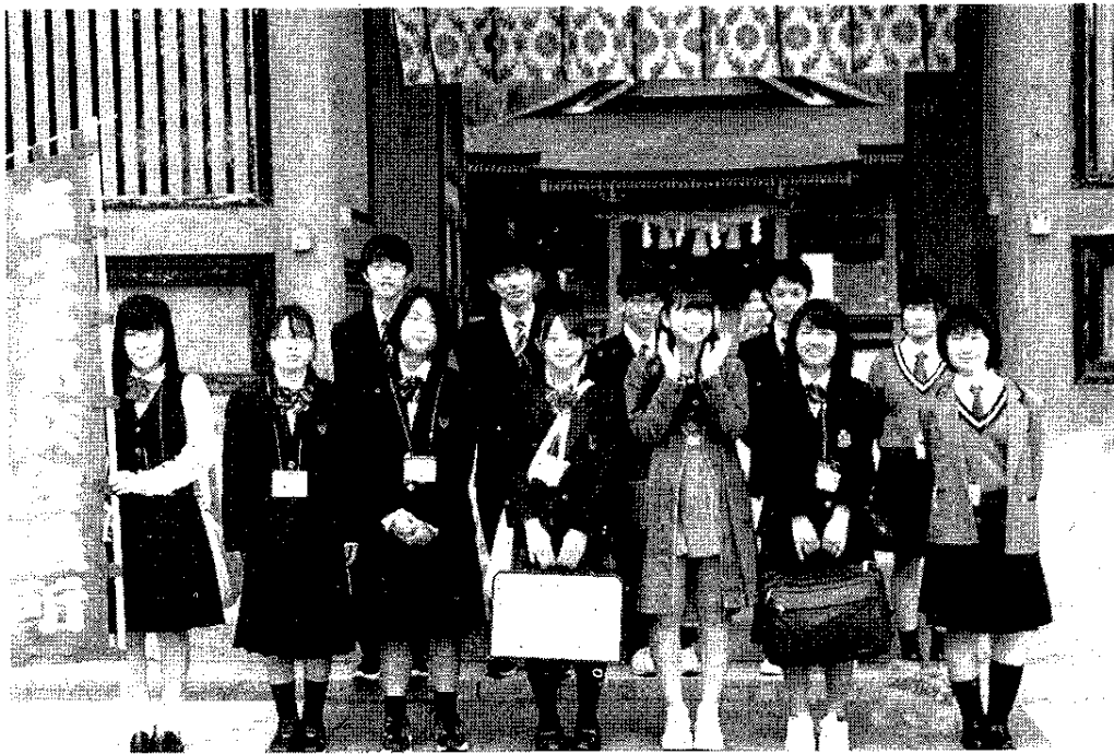
山門前で記念撮影