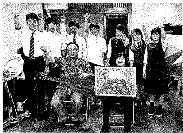
イベントの成功を誓う会員ら

宮フォトと宮PVの両コンテストは、前回県外からも作品が集まったことから、今回は海外も含めて広く応募を促すために、英語表記を盛り込んだ応募要項を作成。ツイッ