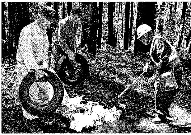
国道469号沿いで古タイヤや多くのごみを回収

富士宮市は「ごみゼロの日」(5月30日)と「全国ごみ不法投棄監視ウイーク」(5月30日-6月5日)に合わせて、30日に富士山麓の環境パトロールを実施した。市と関係機関・団体の十数人が、富士山南麓地域の道路などを巡回監視し、不法投棄された廃棄物の回収にも取り組んだ。