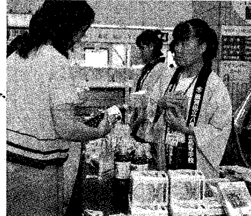
物販ブースで商品説明をする八幡商業高校の生徒

「産物回し」を体験する市役所では近江八幡商人の「産物回し」を体験するため、同校生徒が職員や市民に対し、滋賀県、大阪府、京都府、福井県で仕入れてきた