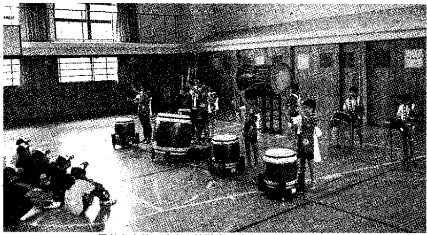
勇壮な太鼓の演奏を披露する井之頭小5・6年生