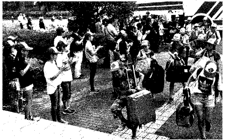
バスから降りて来る近江八幡市の児童を歓迎