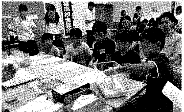
「ダイラタンシー流体」の実験に臨む子供たち