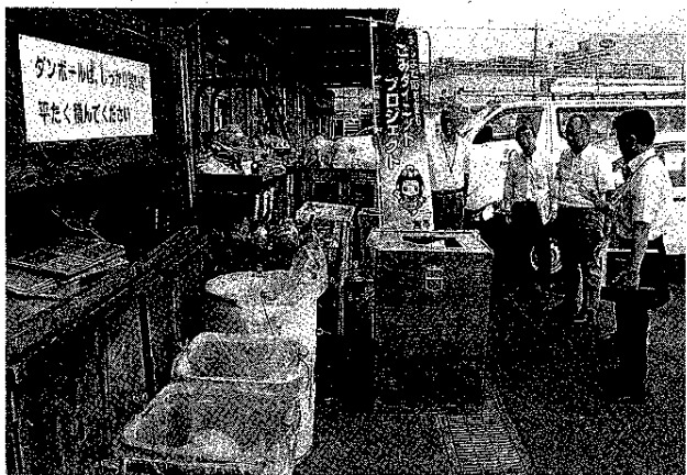
オブリックで紙ごみ分別の効果的な取り組みを見学

富士宮市は「ごみダクトプロジェクト」の一環として、ごみの減量化や再資源化を促すための事業所訪問を実施しており、このほど田中町のエネルギー関連会社オブリックで運動への協力を呼び掛けるとともに、ごみの処理状況や減量対策などを確認した。 同プロジェクトは市民、事業者、行政が一体となって推進している。▽雑紙の分別▽事業系紙ごみの削減▽衣類の分別▽3010運動(宴会などの食べ残り)▽生ごみの削減▽食品ロスの削減の6項目を重点とし、本年度の目標に「清掃センター」に運ばれる可燃