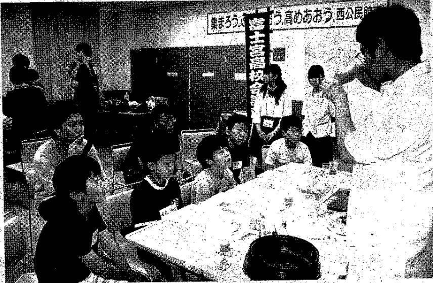
人エイクラ作りの実験

回は小学生の夏休み自由研究応援隊というところで、小学生の自由研究などに活用してもらおうと開催した。講座には小学3年生から6年生10名と、その保護者らが参加して、生物・化学・物理の3つに分かれて、講義や実験などが行われた。はじめに生物の研究では、樹液