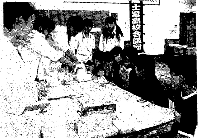
水とかたまり粉を使って不思議な実験に参加する児童ら

生について話をした。各自が持参したペットボトルに、配布された「人エイクラ」を注ぎ、マスのたまご(イクラ)を冷蔵庫(除菌剤・融雪剤)の間隔を数分おきに溶かしてイクラを作った。物理では「ダイラタシオン」現象(水とかたまり粉でできる不思議)に挑戦した。伊東会長は「今回開いた理科自由研究を参