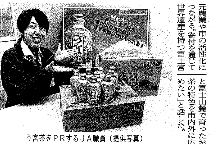
う宮茶をPRするJA職員

J A う宮茶が返礼品 富士宮市のふるさと納税 J A 富士宮の富士宮産茶葉100%のポトル伍緑茶「う宮茶」がこのほど、富士宮市のふるさと納税で返礼品の対象商品となった。う宮茶はブライベート商品として平成16年に発売。290gの飲みきりサイズが好評で、年間30万本を売り上げる人気商品に成長。29年には地元高校生によるデザインでパッケージを一新した。