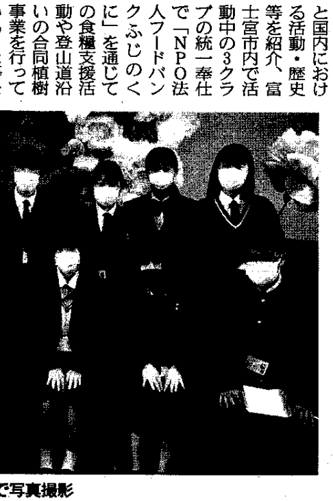
出席者全員で写真撮影

富士宮LCは定期的に年に4回行っており、現在の新型コロナウイルス感染症の影響で輸血用血液不足状態の中で最も重要な事業となっていると話した。 また、市内3クラブで富士宮LCは最も古く、創立から55年の歴史があり、教育支援の分野ではサンタモニカとの交換留学生事業等を長年続けていること等を話し、最後に「皆さんが富士宮市の高校生として、自分の住む街を素晴らしい街にしよう、誇れる街にしようという気持ちで頑張っている姿を見て、心が洗われる気がします。」 1月には活動資金の支援をさせていただいたが、今回はポストカードを作成するとい