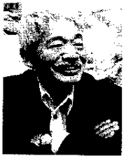
【中村哲医師】(2019・12・4 銃撃され死亡)

②飢餓をゼロに ◎飢餓をなくし、すべての人が1年中安全で栄養のある食料を得られるようにする ※気候変動、干ばつ、洪水などの災害に強い農業を実践する。