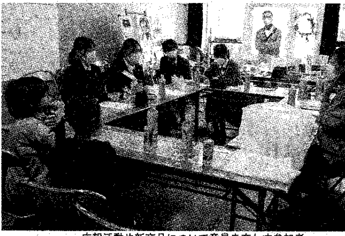
広報活動や新商品について意見を交わす参加者

富士宮高等学校新商品のアイデア 富士宮高等学校新商品のアイデア 富士宮高等学校新商品のアイデア 富士宮高等学校新商品のアイデア