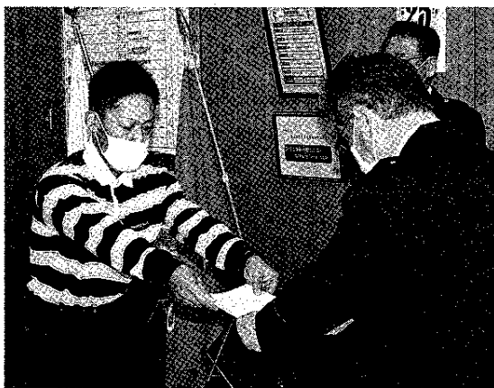
新規隊員への指定書交付

100選出(東海地区ビジネスプラン発表会審査員賞)▽第7回全国ユース環境活動発表大会(関東地方大会最優秀賞)▽2021年度SDGs Quest「みらい甲子園静岡県大会」▽アワード賞。そのほか昨年12月、須藤市長に報告した気候変動アクション環境大使表彰の気候変動アクションユース・アワード賞。 評価された主な取り組みは「マスマス元肥(げんぴ)」で、富士宮