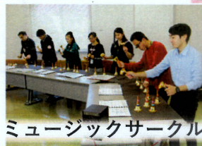
ミュージックサークル