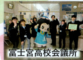
富士宮高校会議所